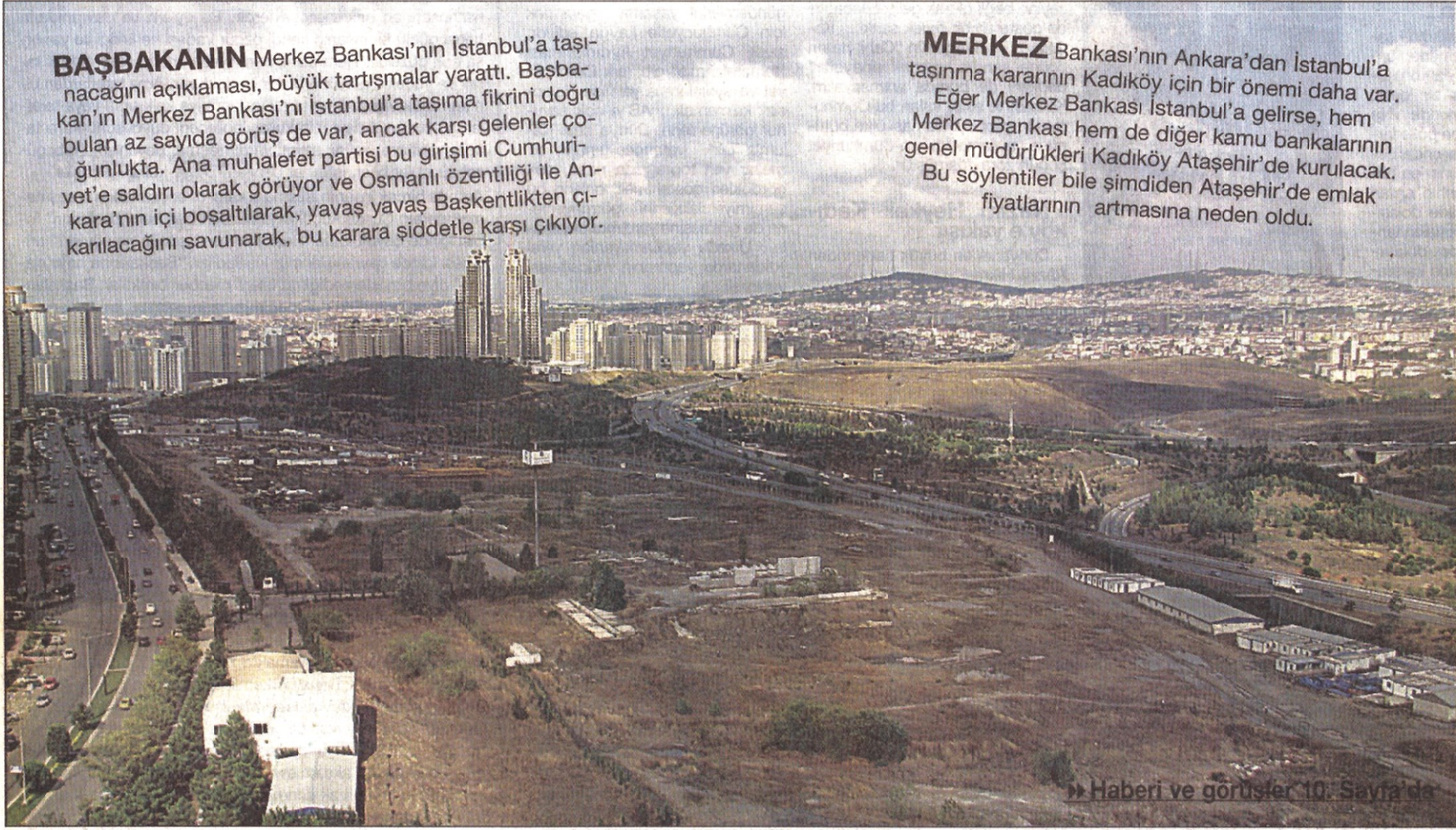
► Haberi ve görüşler 10. Sayfa'da

MERKEZ Bankası'nın Ankara'dan İstanbul'a taşınma kararının Kadıköy için bir önemi daha var. Eğer Merkez Bankası İstanbul'a gelirse, hem Merkez Bankası hem de diğer kamu bankalarının genel müdürlükleri Kadıköy Ataşehir'de kurulacak. Bu söylentiler bile şimdiden Ataşehir'de emlak fiyatlarının artmasına neden oldu.