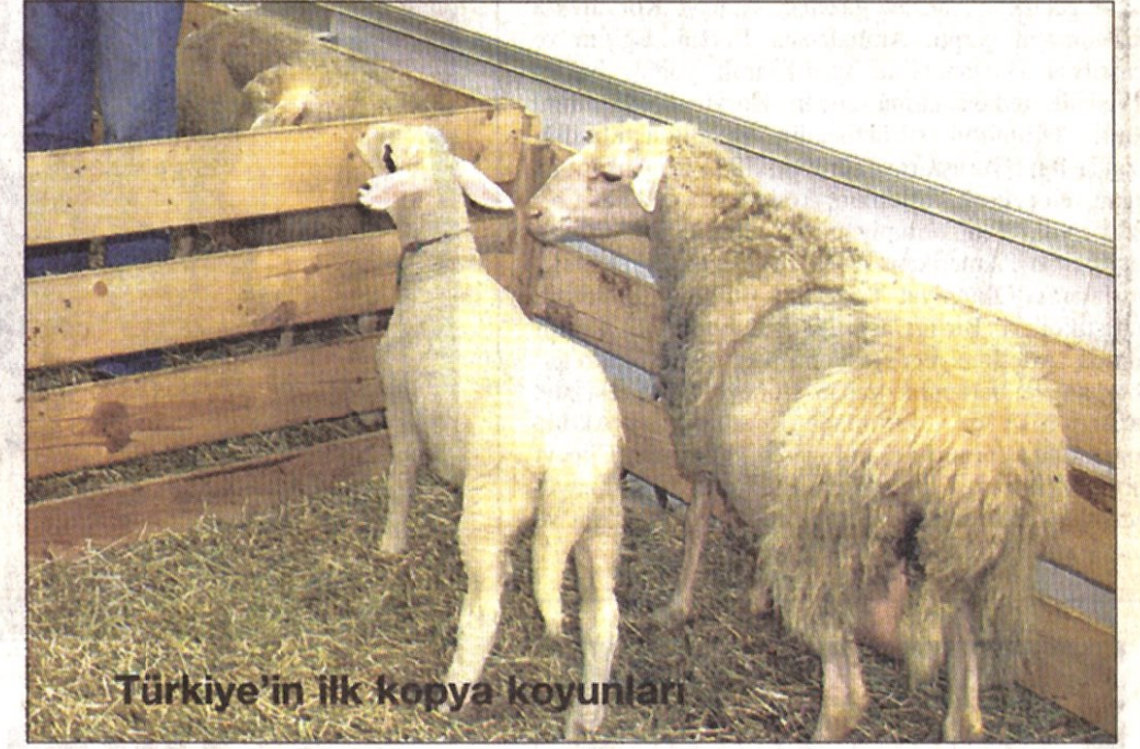
Türkiye'nin ilk kopya koyunları